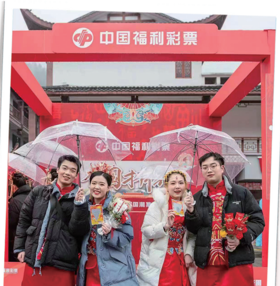
湖南福亮相国潮集体婚礼，推动“福彩+文旅”融合发展。

面向中国式现代化福彩建设新征程，湖南福彩切实践行福利彩票的人民性、国家性、公益性，始终把牢福彩事业发展方向，积极回应“时代之问”“人民之需”，更好服务民政民生事业，更好增进民生福祉，彰显福彩人的责任担当。