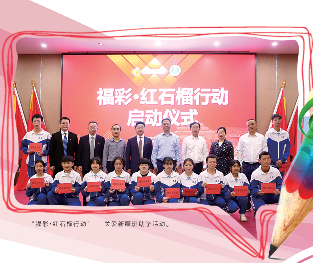
“福彩·红石榴行动”——关爱新疆班助学活动。