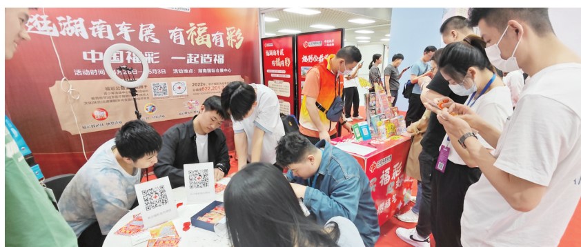
湖南福彩为2023年湖南车展增彩。