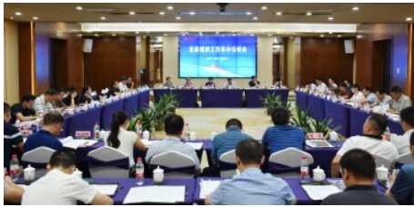
• 全省福彩工作年中分析会在郴州召开

界合作为切入点，在市城区大力探索开展福彩“进社区、进企业、进园区”试点活动，全年完成59个“三进”网点布局；以销售亭建设为发力点，主动与城管、自然资源和规划、市政公司、郴电国际等部门积极协调，对外招选有销售经验、有能力的优秀业主参与销售亭运营管理，全市已有9家销售亭（市中心城区5家、安仁县4家）上线运营并初见成效。