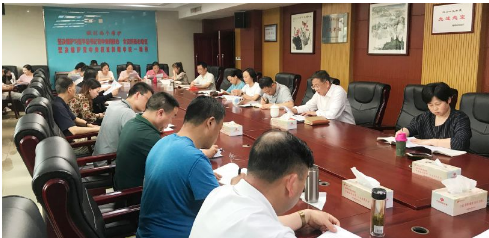
▲省福彩中心召开半年度工作推进会