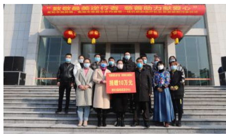
• “致敬最美逆行者 慈善助力献爱心”活动