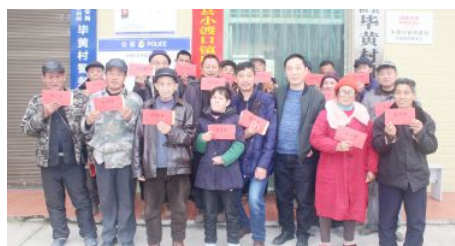
• 常德福彩开展“春节送福”慰问老人活动