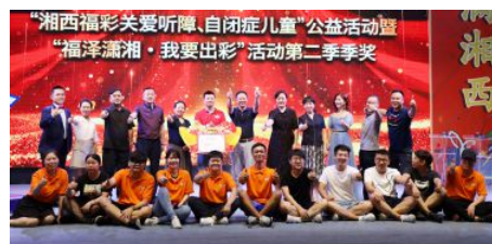
• 开展“关爱听障、自闭症儿童”公益活动