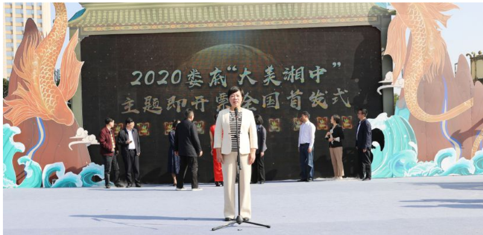
▲湖南福彩“大美湘中”主题即开票全国首发式在娄底举行