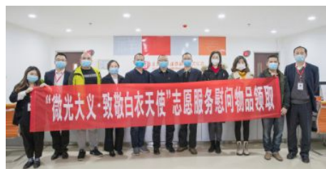
• “微光大义·致敬白衣天使”志愿服务张家界站

疫情期间慰问8个敬老院、1个儿童福利中心，投入资金4万元；积极参加“微光大义·致敬白衣天使”公益慰问活动，践行“扶老助残救孤济困”发行宗旨。