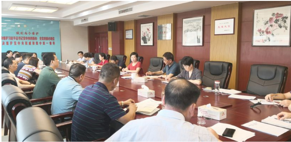
▲省民政厅副厅长陈慈英到省福彩中心调度工作