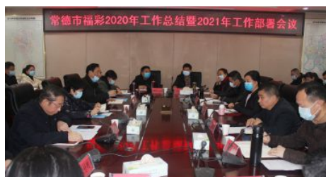
• 常德福彩召开福彩工作会议

稳妥开展中福在线游戏退市停销工作，确保了全市停销工作平稳顺利实施；大力做好新游戏上市工作，共有200家福彩专营投注站开通快乐8游戏；大力开展营销活动和渠道建设，共有1个销售亭、22个投注站被评为文明投注站。全市新增销售亭5个、行业合作网点21个、净增投注站34个。