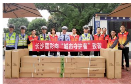
• 长沙福彩向“城市守护者”致敬