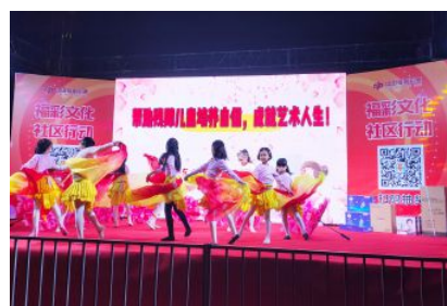
• 岳阳福彩公益文化走进鱼巷子社区主题活动