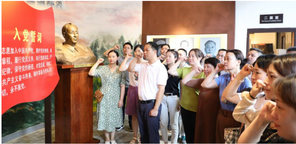
▲省福彩中心党员重温入党誓词