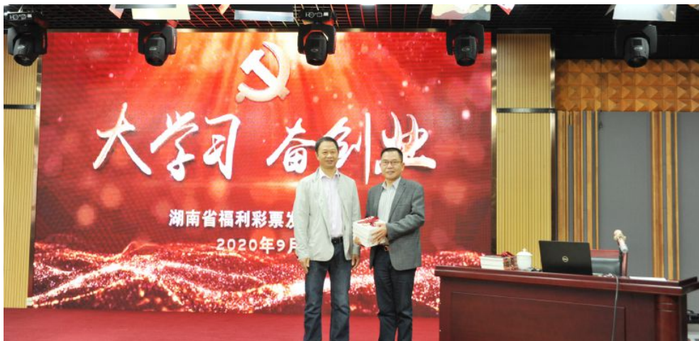
▲省福彩中心开展“福彩青年说”主题学习分享会