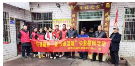
• 开展“公益福彩·春节送温暖”公益慰问活动