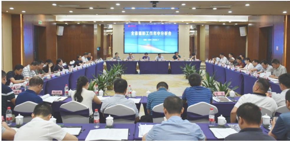
▲全省福彩工作年中分析会现场