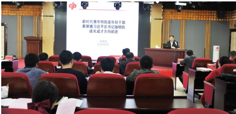
▲省福彩中心党总支开展“支部书记上党课”活动