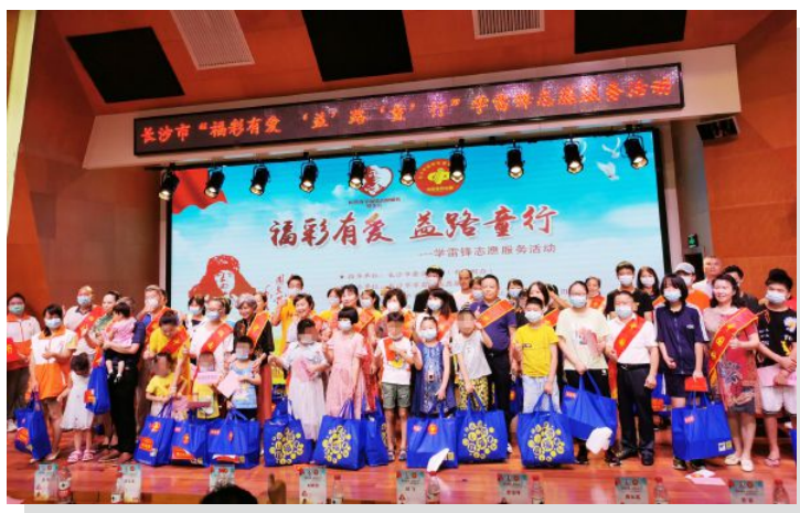
• “福彩有爱 益路童行”公益慰问活动