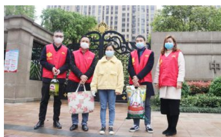
• 市福彩中心走访慰问援鄂医务人员家属