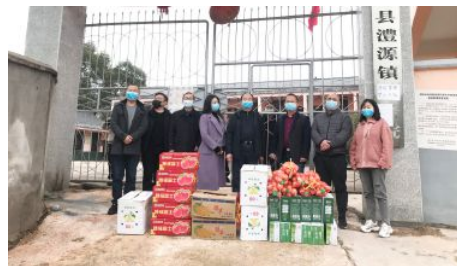
• 福彩有爱走进澧源镇敬老院