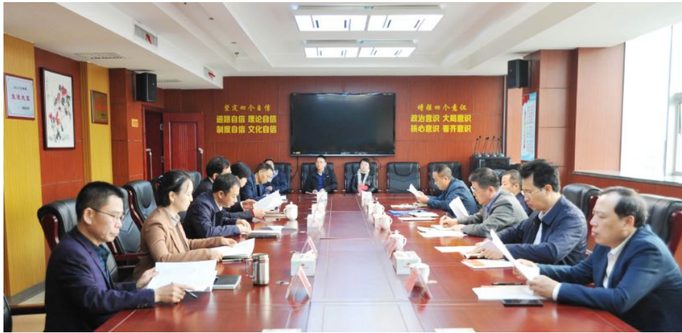
▲省民政厅党组书记、厅长曹忠平到省福彩中心调研指导工作