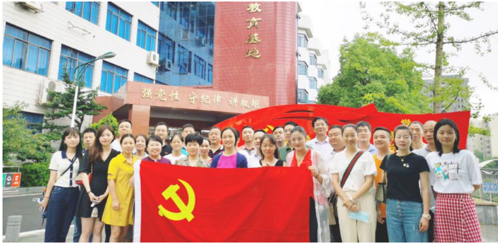
▲省福彩中心党总支组织党员干部赴长沙市廉政警示教育基地开展党风廉政建设教育活动