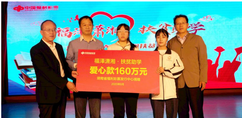
▲省福彩中心为“福泽潇湘·扶贫助学”公益活动捐赠160万元