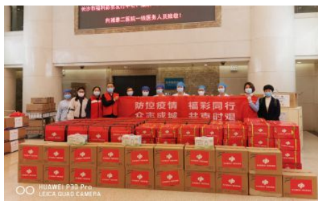
• 疫情期间市福彩中心策划开展“大爱福彩 春光暖星城”系列公益慰问活动

先后联合省福彩中心、长沙市文明办、长沙市学雷锋志愿服务基金会、长沙广电新闻中心、开福区交警大队、长沙慈善会等多个部门，投入资金近百万元，策划实施了2019年度福彩公益金使用情况公示暨“福泽潇湘·我要出彩”第一季季奖活动、“福彩送福·益路童行”“福泽潇湘·彩耀星城”“福泽潇湘·向城市守护者致敬”“快乐8”首发式、“善耀星城”公益慈善嘉年华等系列主题公益宣传活动，惠及困难群众上万人次，打造了长沙福彩品牌矩阵；联合市文明办探索福彩领域便民利民载体，建成“雷锋公益驿站”10家。