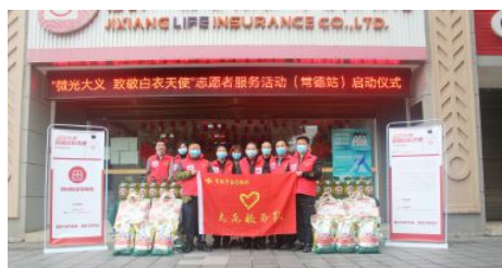
• 举办“微光大义·致敬白衣天使”志愿服务活动