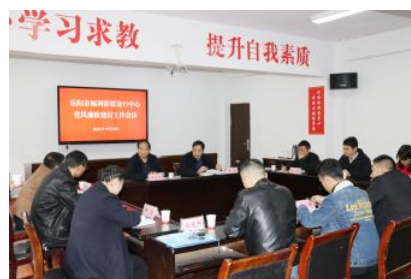
• 市福彩中心召开党风廉政建设工作会议