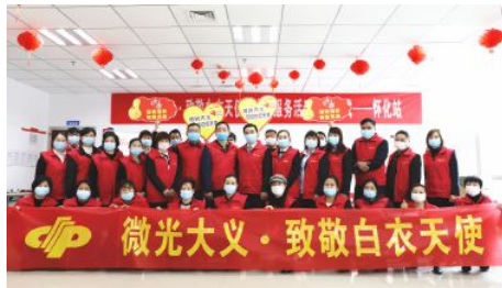
• 开展“微光大义 致敬白衣天使”公益活 动，走访慰问72名援鄂医务人员及家属。