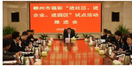
• 组织召开福彩“三进”推进会