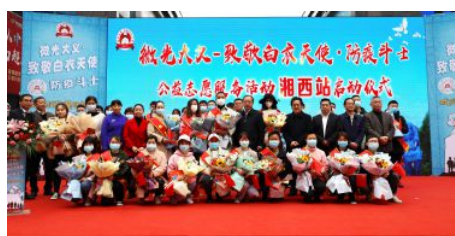
• “微光大义·致敬白衣天使”公益志愿服务活动湘西站