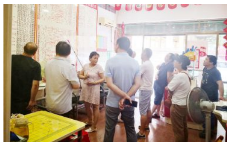
• 永州“千站帮扶”业主实地培训现场

相关工作；强化帮扶工作，被帮扶站点销量同比平均增加24万元，销售总量同比增幅99.43%，排名均为全省第一；强化能力建设，持续开展业务培训，提升市场销售能力，稳定销售队伍，开展培训201场次，培训8440人次。全年共销售福利彩票3.48亿元，总量跃居全省第二，筹集福彩公益金1.13亿元。