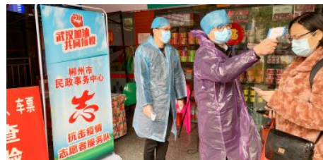
• 疫情期间在火车站开展志愿服务活动