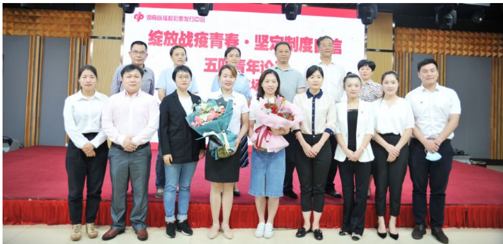
▲省福彩中心举办第二场五四青年论坛