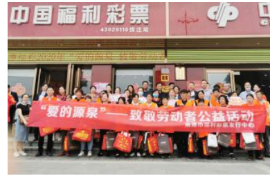
• 举行“爱的源泉·致敬劳动者”公益活动