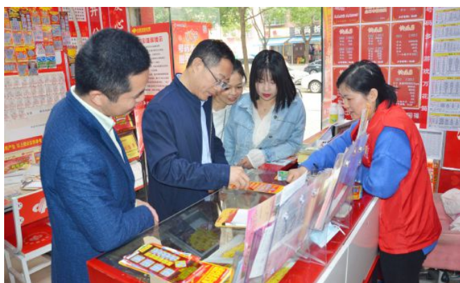
• 市民政局领导调研福彩站点

2020年，长沙市福彩认真贯彻全省福彩总体部署，积极克服和应对疫情突发、政策调整等影响，深入销售一线督导防疫复市工作。以“一增两保三稳三重”（增信心、保份额、保排名、稳销售、稳市场、稳队伍、重渠道、重创新、重安全）为工作主线，展现担当作为，精准谋划发力，促进了福彩工作高质量发展。全市共销售福利彩票16.97亿元，在少销49天的情况下，在售游戏正增长3%，筹集公益金5.21亿元，其中市级1.3亿元，总销量排名全省第一。即开票逆势增长18%，居全国省会城市第六。疫情期间率先在全国出台站点救助、购买团体防疫险、减租倡议等帮扶政策；制定《2020-2022年长沙福彩增机布点三年行动方案》；启动长沙福彩“惠泽星城创业助力”行动计划，稳住了渠道、队伍和主阵地。即开票销售、新游戏试点获得中福彩中心通报表扬；被省福彩中心授予全省绩效考核一类单位、新游戏试点先进单位；中心领导班子被市民政局党委评为一等领导班子；中心党支部被市民政局党委评为十佳党小组。