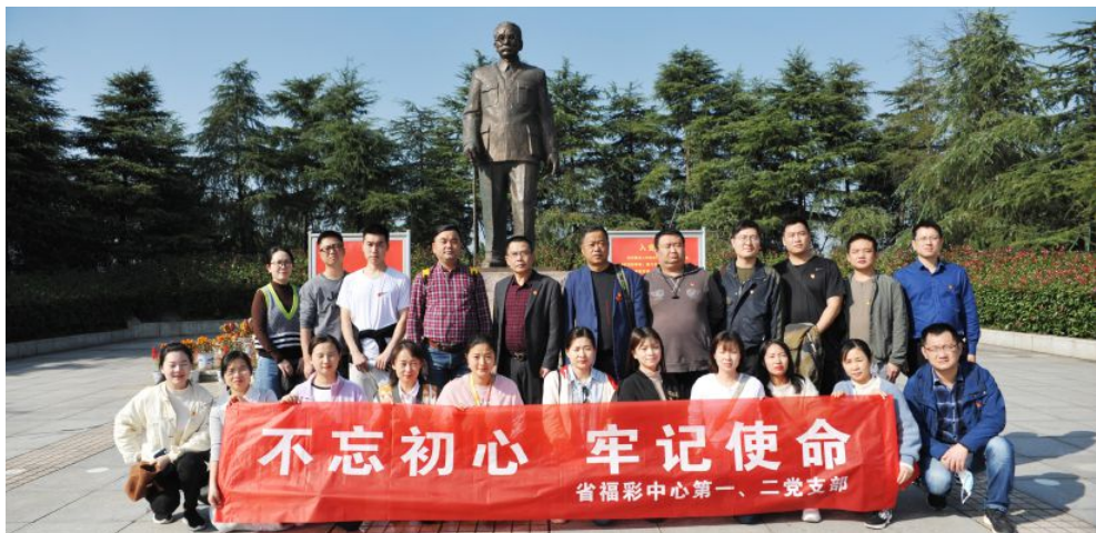
▲省福彩中心第一、二党支部前往常德市开展主题党日活动