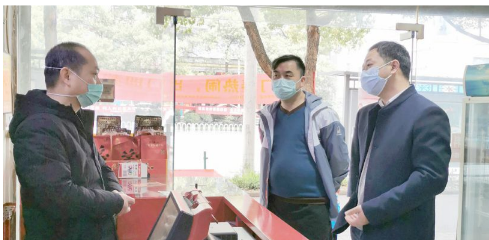
▲省福彩中心调研组督查站点防疫工作