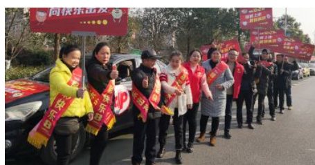
• 开展福彩“快乐8”新游戏宣传