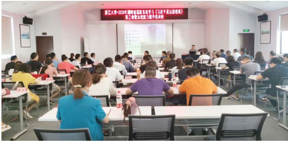
▲省福彩中心举办全省福彩系统学习《习近平谈治国理政》第三卷暨治理能力提升培训班