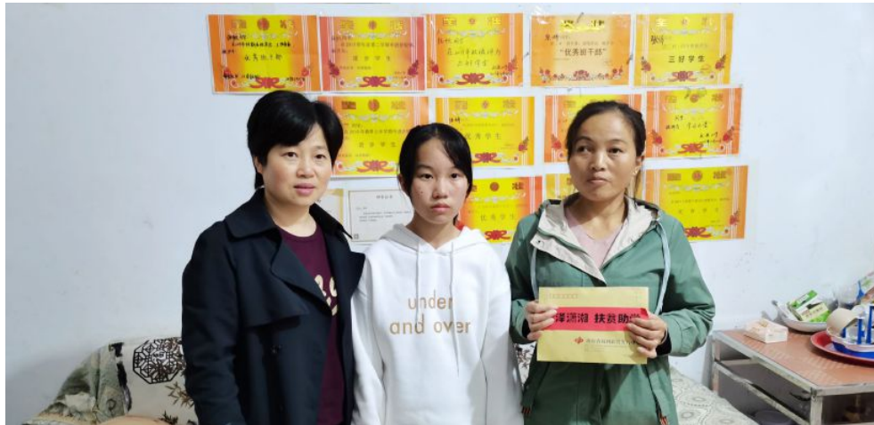
▲省福彩中心党总支成员前往省民政厅扶贫联系点湘西自治州泸溪县红岩村开展“福泽潇湘 扶贫助学”主题党日