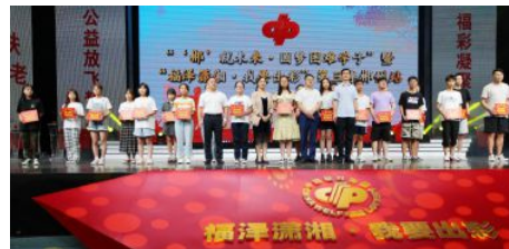
• 开展“‘郴’就未来·圆梦困难学子”公益助学活动

积极参与火车站、社区抗疫公益服务，在全省“微光大义·致敬白衣天使”公益志愿服务行动中，完成对46名援鄂医护人员家属的走访慰问；承办“福泽潇湘·我要出彩”第三季活动，为23名贫困大学生给予每人3000元圆梦助学金，充分体现福彩的公益属性。