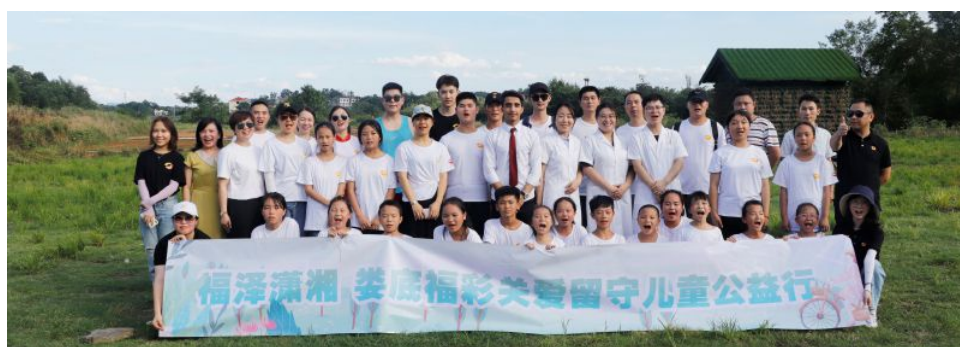
• 娄底福彩公益行——“梦想榜样”关爱农村留守儿童活动