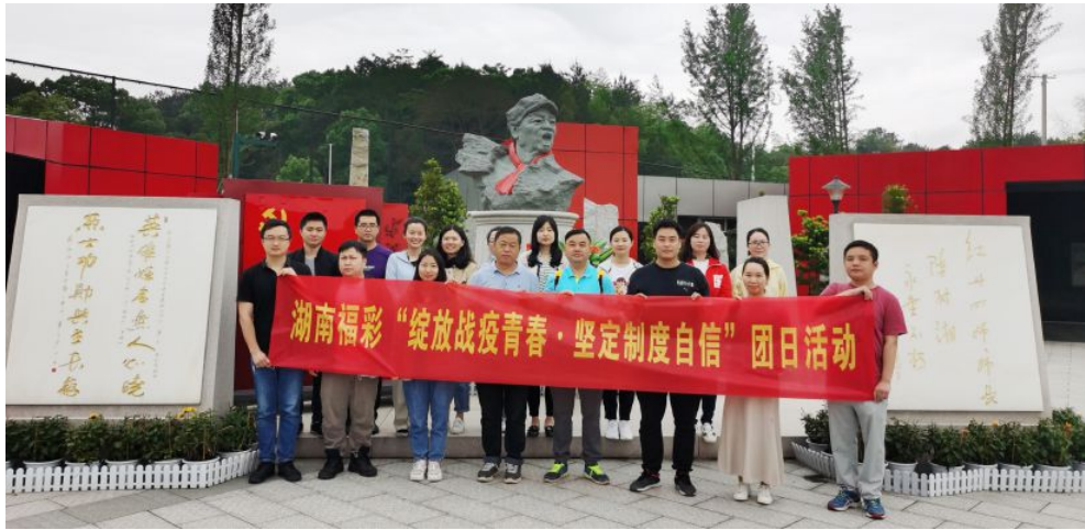
▲“五个一”团建活动——陈树湘纪念馆