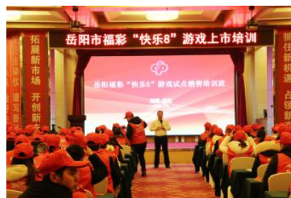
• 岳阳市福彩“快乐8”游戏上市集中培训

2020年，岳阳市福彩累计销售2.31亿元。在疫情和福彩政策调整的双重影响下，市中心保持福彩市场开发投入力度，累计投入资金近100万元，用于开展福彩公益宣传和电脑票、即开票游戏市场营销以及站点业主营销补助，有力稳住全年福彩销售基本盘；创新公益宣传方式，积极开展“福彩公益文化进社区”主题活动，以群众喜闻乐见的形式开展大型福彩公益主题活动路演和即开票游戏体验活动3场，覆盖群众近2000人次，有力扩大了福彩公益品牌影响力；坚持实施“走出去”战略，主动与高铁站、汽车站、大型商超等进行对接，开展跨界合作，全年新增福彩兼营店34个；利用节假日在旅游景区、房展、车展等场地，开展即开票小卖场活动，全年开展小卖场11场，销售即开票近20余万元，夯实了发展基础，拓展了市场渠道。