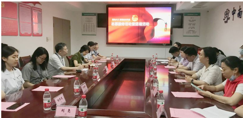
▲省福彩中心团总支与湘雅二医院团组织联合开展团建活动