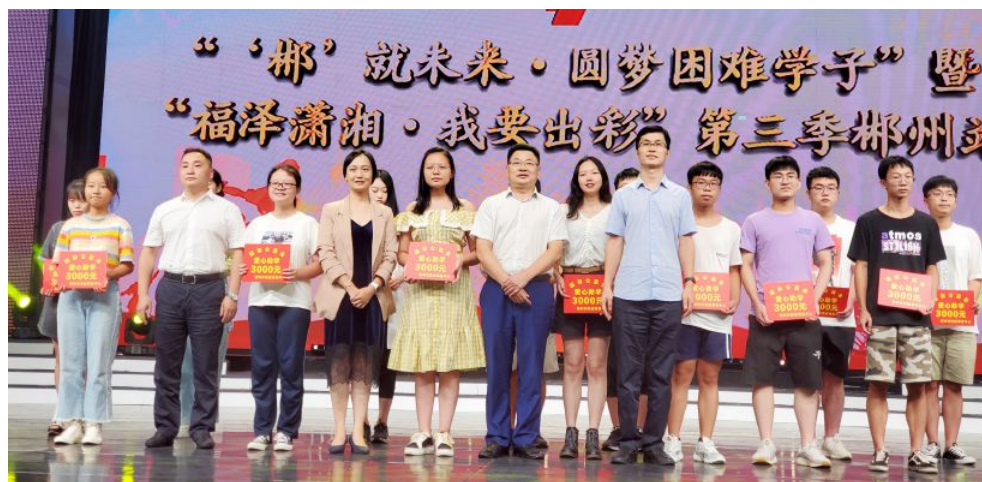
▲“福泽潇湘·我要出彩”第三季在郴州举行