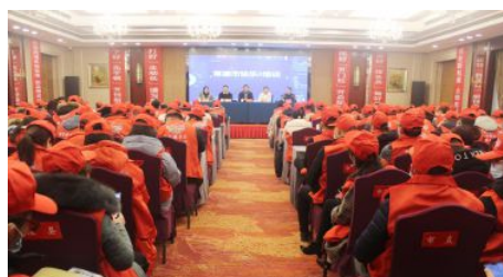
• 常德福彩举办培训活动