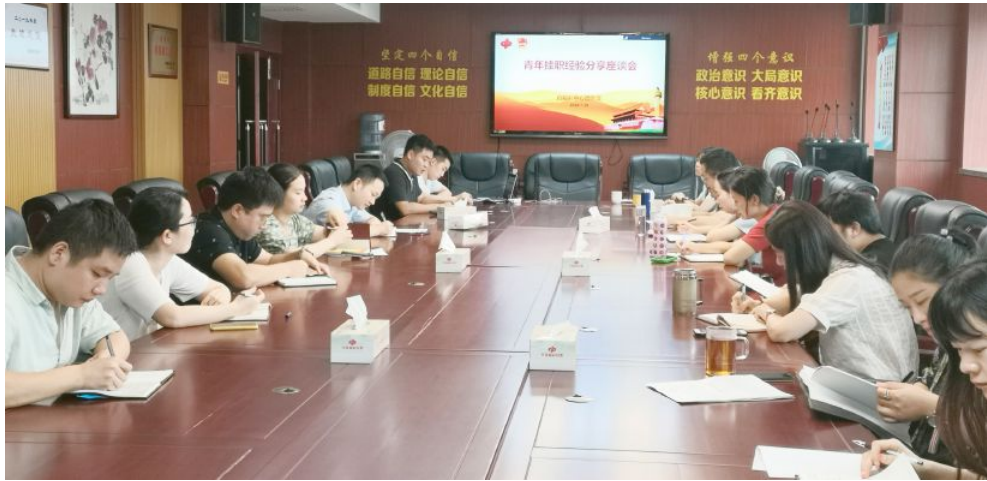
▲省福彩中心团总支举行青年员工工作经验分享座谈会