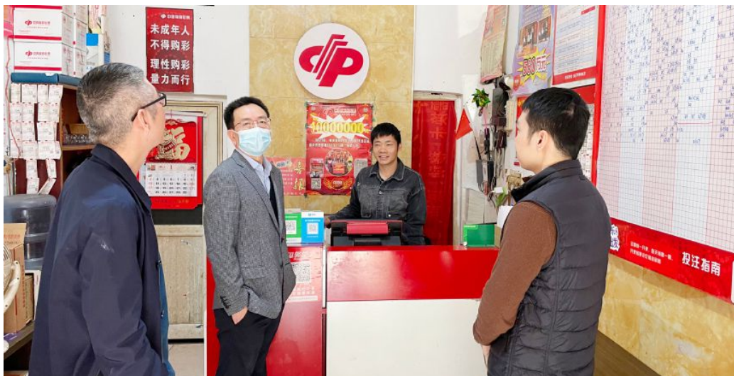
• 市民政局领导走访市区投注站

2020年，株洲市福彩投注站点达474家，福彩销量达2.56亿元，筹集公益金8000万元，全省排名第9。一年来，市县各级管理部门认真做好疫情防控工作，第一时间推进复工复产，确保发展和安全两不误，全年实现零感染、零病例、零事故，在促发展、稳就业、保民生等方面做出了应有贡献。开展“微光大义·致敬白衣天使”志愿服务活动，走访慰问抗疫一线医护人员家属82户。创新市场营销，和阿里公司合作有4家站点已经进入正常运营模式，与鑫瑞惠民供销合作的一家站点也于12月18日正式开业。制定绩效管理辦法，理顺工作机制，开展竞聘上岗，打击地下私彩，建设互联网宣传平台，市场发