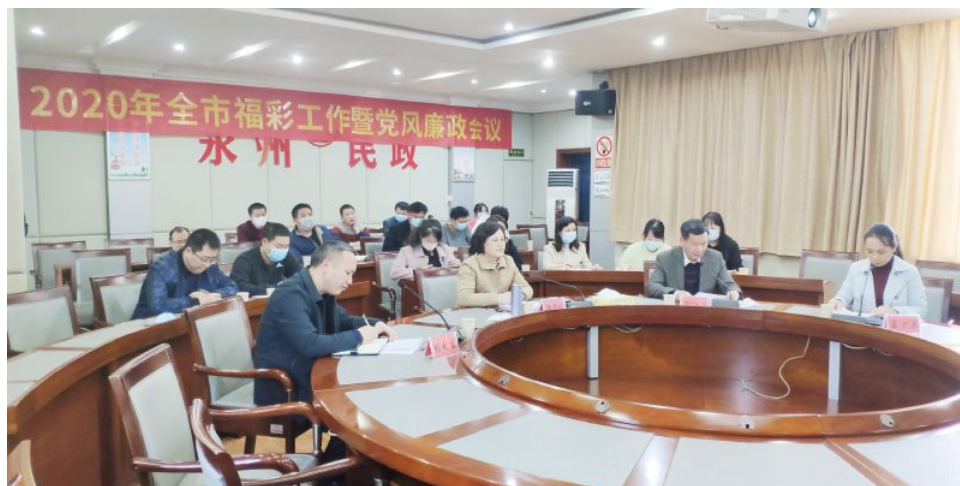
• 市民政局召开2020年全市福彩工作暨党风廉政视频会

2020年，永州市福彩秉持公益理念，坚持“安全运行、健康发展”的工作方针，优化工作思路，大力发展绿色、可持续的福彩销售市场；强化制度建设，规范运行程序，优化工作方案，修订完善《财务管理制度》《市场管理员管理办法》《公务接待管理办法》等规章制度；加强疫情防控，落实落细联防联控工作，有条不紊地开展疫情防控与复市准备