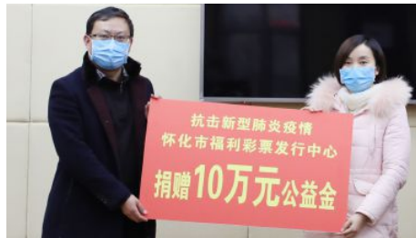
• 怀化福彩捐赠10万元公益金用于抗击疫情