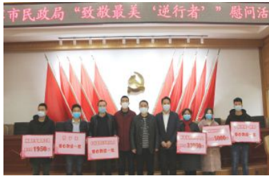
• 举行“致敬最美逆行者”公益活动

点分级分类培训，稳定了现有渠道。开展“大干一百天”全员拓展销售渠道竞赛、开展庚子鼠、南岳衡山等即开票营销活动、做好“快乐8”首批试点工作，有效激活了福彩市场。开办全省首家自营店，打造了全省首家集形象展示、文化传播、孵化培训等功能于一身的综合性销售站点，展示了福彩新形象。