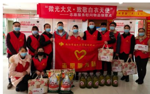
• “微光大义·致敬白衣天使”公益志愿服务衡阳站活动