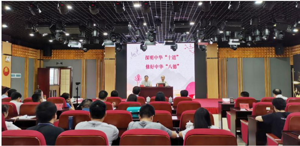
▲省福彩中心举办《深明中华“十道”，修好中华“八德”》专题辅导授课