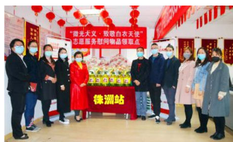
• “微光大义·致敬白衣天使”公益行动株洲站启动