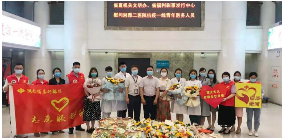
▲省福彩中心开展“微光大义·致敬白衣天使”志愿活动