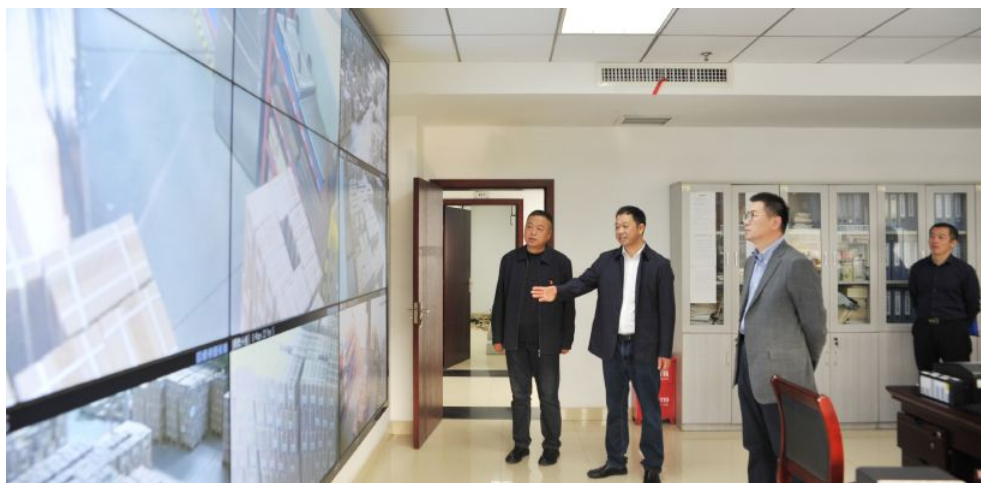
▲省民政厅党组书记、厅长曹忠平到省福彩中心调研指导工作