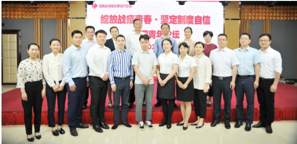
▲省福彩中心举办“绽放战疫青春·坚定制度自信”第一场五四青年论坛