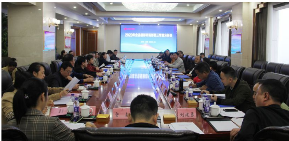
▲全省福彩市场形势三季度分析会暨市州福彩工作促进会在湘潭召开