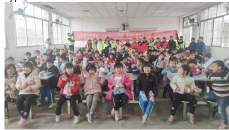
• 永州福彩前往排龙山学校开展“免费午餐”慈善公益项目知识竞赛活动

和福彩公益驿站，为市民及户外工作者提供饮水、休息、手机充电、租借雨伞等无偿服务。