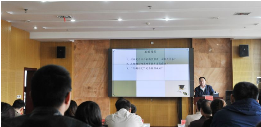
▲省福彩中心举办湘彩讲堂