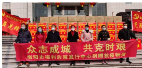
• 向市慈善总会定向捐赠价值8.2万余元 医用防护服3120件