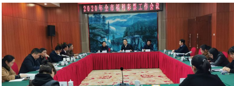
• 2020年娄底市福利彩票工作会议

21家投注站规范化建设，新建3个即开票销售亭，开展111场即开票小卖场销售，开发了主题鲜明又具本地特色的本土即开票——“大美湘中”，并于10月18日上市，10月23日在娄底举行全国首发仪式。