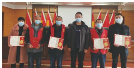
• 开展关爱留守儿童公益慰问活动