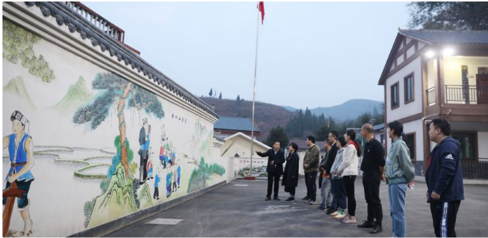
▲省福彩中心党总支前往省民政厅扶贫联系点湘西自治州泸溪县红岩村开展“福泽潇湘 扶贫助学”主题党日活动