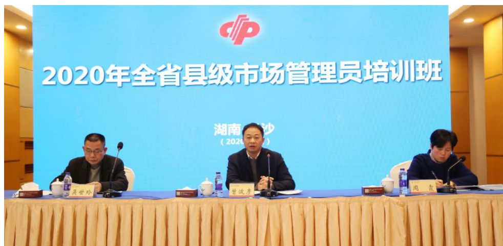
▲省福彩中心举办全省福彩县级市场管理员培训班