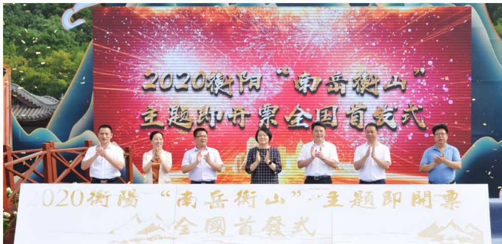
▲“南岳衡山”即开票全国首发仪式在衡阳市举行