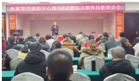
• 举办快乐8试销站点销售技能培训会

元、阶段性代销费补助9.87万元；加强宣传营销及培训工作，组织开展“超级幸运”“南岳衡山”“福泽潇湘·我要出彩”“金喜奖上奖”、双色球派奖等活动，开展各类培训35场次，组织开展“快乐8”新游戏上市销售工作；指导慈利县开展即开票户外联销活动共销售502万元，指导永定区开展即开票小卖场销售334万元。