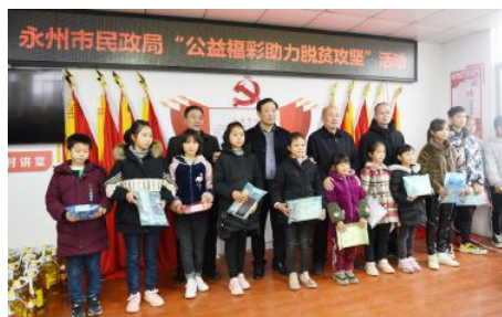
• 公益福彩助力脱贫攻坚