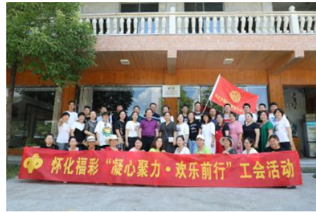
• 怀化福彩开展“凝心聚力 欢乐前行” 户外拓展活动