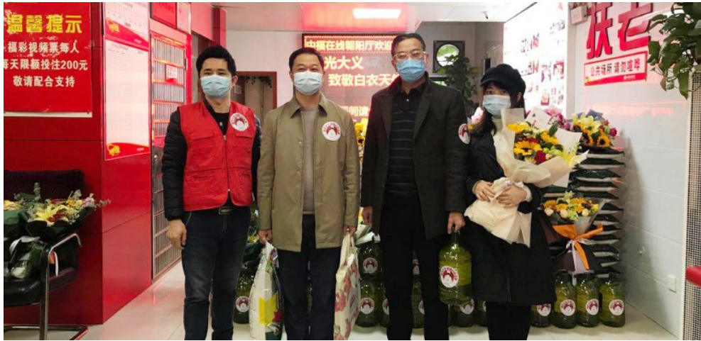
▲省福彩中心主任参加“微光大义·致敬白衣天使”志愿活动