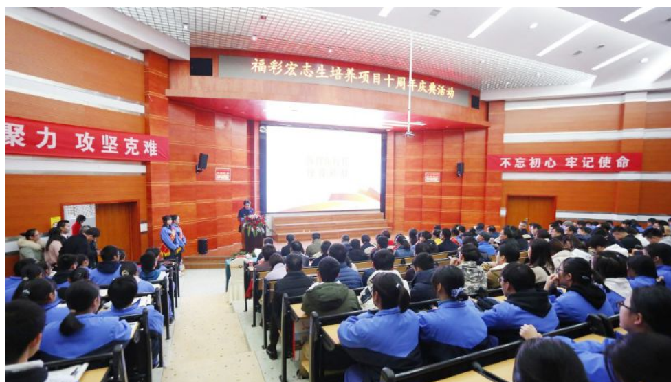
• 福彩宏志生培养项目十周年庆典活动现场

学40名贫困学生，让他们完成高中学业。10年来，株洲市福彩中心对该项目资助金额达320万元，帮助千余名贫困学子圆了上学梦，受助学生在校期间不但学费、书本费全免，还可享有适当的生活补助。