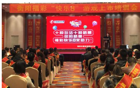
• 福彩“快乐8”新游戏上市启动仪式

2020年，衡阳市福彩坚持党建引领，积极探索疫情防控常态化条件下福彩销售管理工作，稳推视频票销售厅转型，夯实销售渠道，挖掘市场潜力，突出社会责任，擦亮公益底色，全年销售福利彩票3.41亿元。开发本土特色即开票“南岳衡山”，举办了“南岳衡山”即开票全国首发仪式，创下全市本土票上市销售记录；举办两场即开票区域小奖组联销；快乐8成功试点销售；加强站点巡查，规范站点销售行为；优化岗位设置，首次组织开展中心工作人员竞聘上岗工作；创新培训工作，开展培训530余场，培训10600余人，每月举办读书会主题分享、业务考试；推进落实省中心“十百千万”工程，开展“千站帮扶”活动。