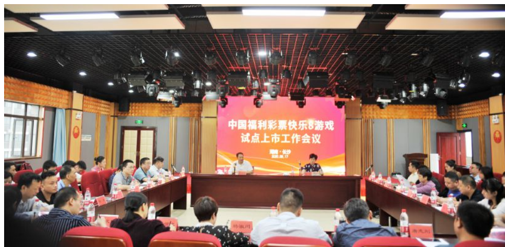
▲省福彩中心召开快乐8试点上市工作会议