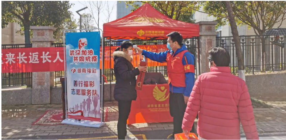
▲“善行福彩志愿服务队”开展疫情防控志愿服务活动