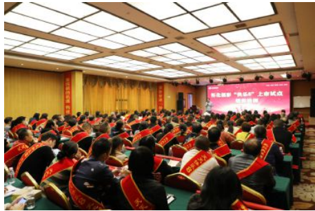
• 怀化福彩举办全市快乐8上市试点集中培训