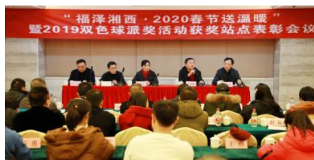
• 召开双色球派奖活动表彰会议

2020年，湘西自治州福彩坚持“安全运行、健康发展”的工作方针，以党的政治建设为统领，克服疫情带来的不利影响，疫情期间从业务费等经费中配套下发近100万元给予全州福彩投注站门面租金补助，并给全州投注站配备了测温枪、口罩、消毒水、洗手液等防疫物资，确保了全州300多个投注站防疫工作开展，站点如期复工复产；围绕福彩“二次创业”契机，抓住快乐8试点上市机会，深化品牌形象推广，积极作为，努力拓展市场，确保了全州福彩销售持续健康发展，全年共销售福利彩票2.77亿元。