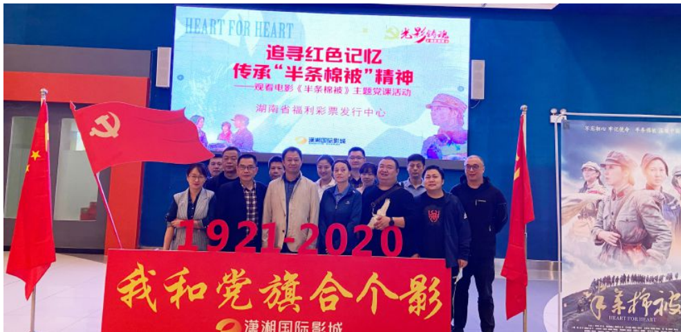
▲省福彩中心党总支组织开展“光影铸魂”电影党课活动，观看电影《半条棉被》