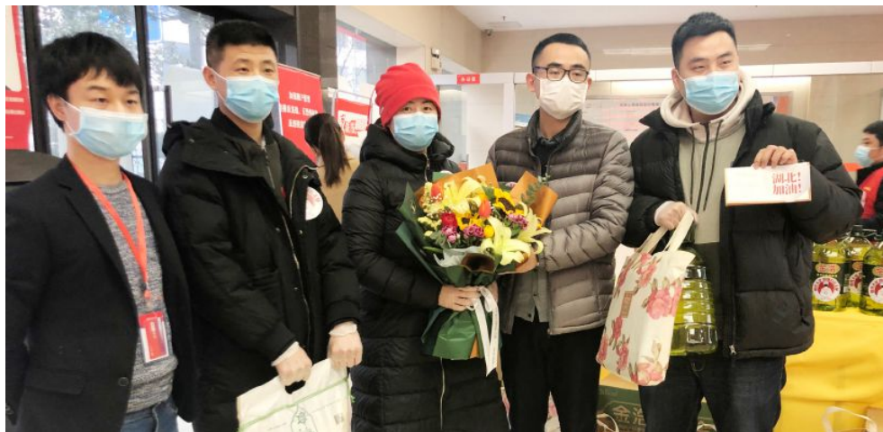
▲省福彩中心志愿服务队员参加慰问援鄂医护人员活动