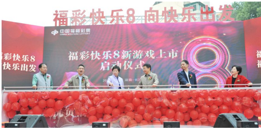
▲福彩“快乐8”湖南首发式在长沙举行