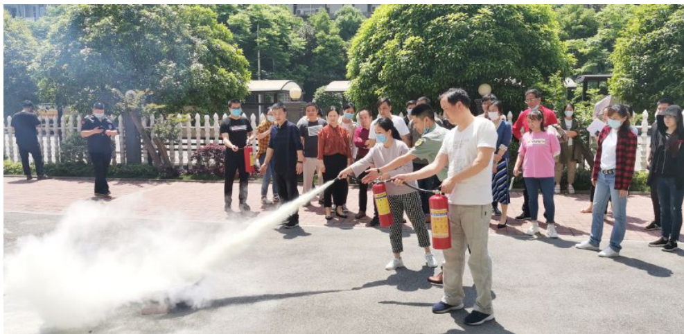
▲省福彩中心组织消防演练